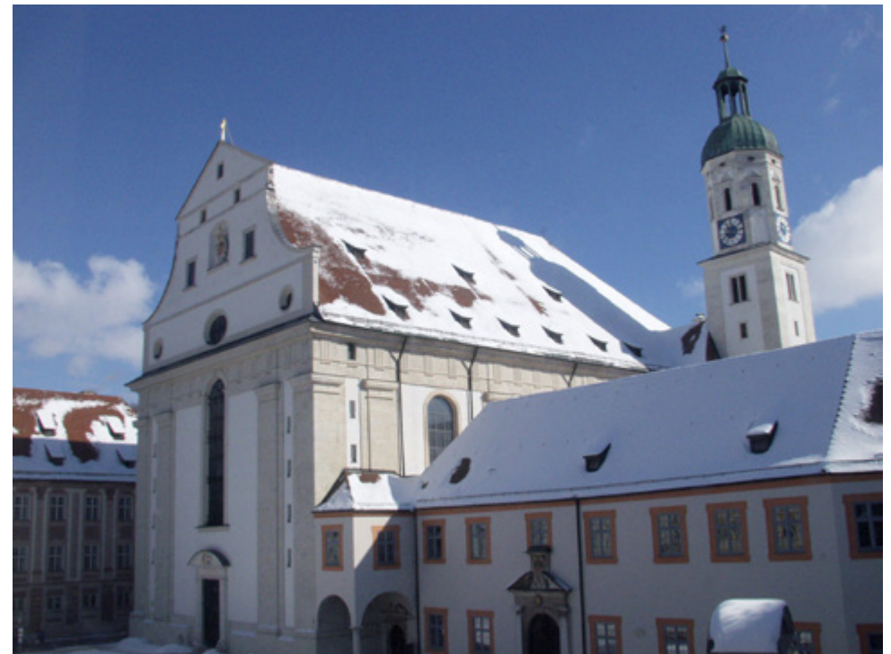
Schutzengelkirche in Eichstätt

Die Kosten für die oben beschriebene Messtechnik liegen für drei Logger inkl. Software zur Auswertung meist im Bereich von etwa 500 € und damit schon nennenswert unter der zu erwartenden Energiekosteneinsparung allein in der folgenden Heizsaison; ganz zu schweigen von den Kosten, die entstehen, wenn die Überschreitung der zulässigen Feuchte erst durch Schäden an Gebäude, Orgel oder Ausstattung erkennbar würde. Mit den Geräten sollte das Raumklima auch über die Heizsaison hinaus dauerhaft aufgezeichnet und regelmäßig ausgewertet werden. Wichtig ist, während der Heizperiode die Geräte auszulesen, um Veränderungen im Raumklima frühzeitig zu erkennen.