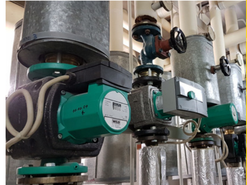
Heizung im Jugendtagungshaus Schloss Pfünz