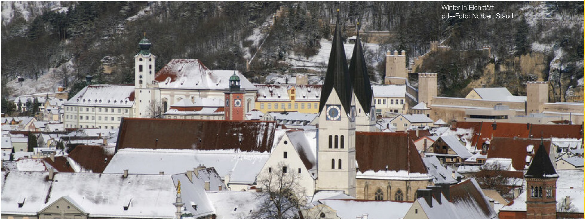
Winter in Eichstätt

Bistum Aachen, Erzbistum Berlin, Bistum Eichstätt, Bistum Erfurt Bistum Essen, Erzdiözese Freiburg, Bistum Fulda, Bistum Görlitz Bistum Hildesheim, Erzbistum Köln, Bistum Limburg, Erzbistum München-Freising, Bistum Münster, Bistum Osnabrück Bistum Passau, Diözese Rottenburg-Stuttgart, Bistum Speyer Bistum Trier, Bistum Würzburg